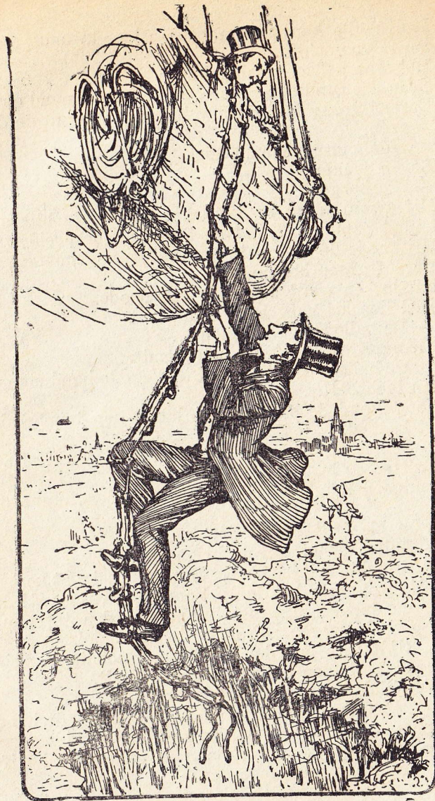
Robert klauterde vlug als een kat naar boven. (Blz. 338)